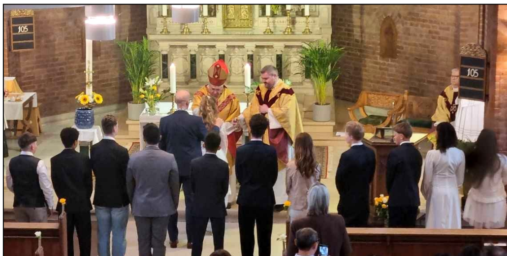
Fra firmelsen lørdag den 18. april 2026 i Skt. Vincent Kirke, Helsingør

Mandag den 24. august kl. 19 afholdes et fælles informationsmøde for forældrene til de børn som skal gå på ét af de to hold. På mødet vil der være konkret information om de enkelte hold. Undervisningen starter søndag den 30. august efter 9-messen.