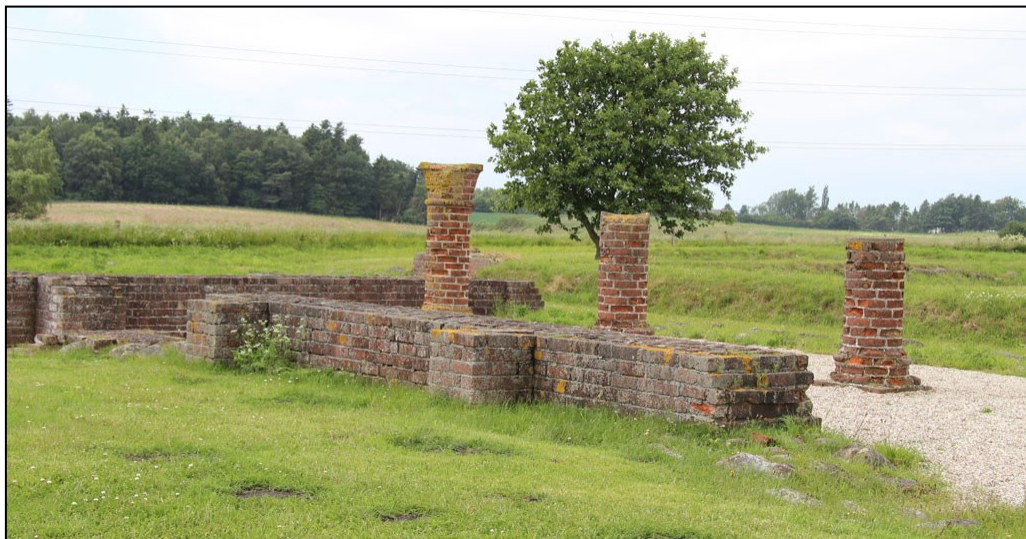
Ruinen af dét som engang var Æbelholt Kloster, lidt udenfor Hillerød.